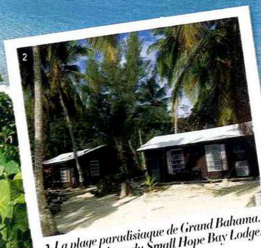
1 La plage paradisiaque de Grand Bahama. 2 Les bungalows du Small Hope Bay Lodge.